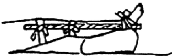
Рис. 3. Наложение шин при переломе костей голени

При переломе черепа пострадавшего уложить на носилки таким образом, чтобы голова была несколько приподнята, по бокам ее уложить два валика. На голову положить холод.