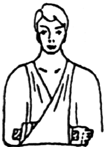
Рис. 2. Положение шин при переломе костей предплечья

Шины накладывают таким образом, чтобы они захватывали не менее двух суставов, между которыми находится перелом. Под шины нужно подложить мягкий материал - вату, полотенце и пр. (Рис. 2 и 3).